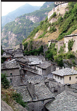
Taken täckta av "lose"

dominerar passet som passeras av en flod och av en enda framkomlig väg – är som byggd för att befästas. Det var därför som Carlo Felice av Savojen, rädd för ett nytt franskt angrepp, inledde återuppbyggandet cirka trettio år efter Napoleons genomfart.